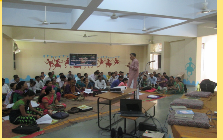
રાષ્ટ્રીય રોલપ્લે અને લોકનૃત્ય સ્પર્ધા