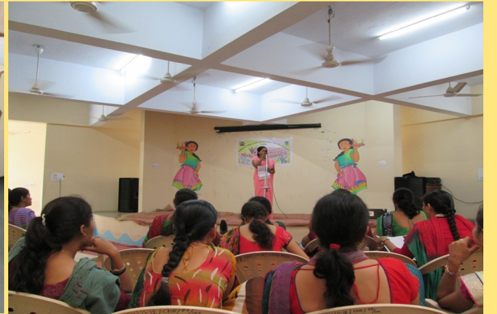
મહિલા સશક્તિકરણ નિમિત્તે યોજાયેલ વિવિધ સ્પર્ધાઓ