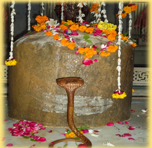
વધુ આવતા અંકે