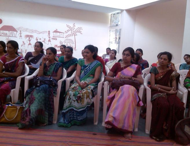
મહિલા દિનની ઉજવણી