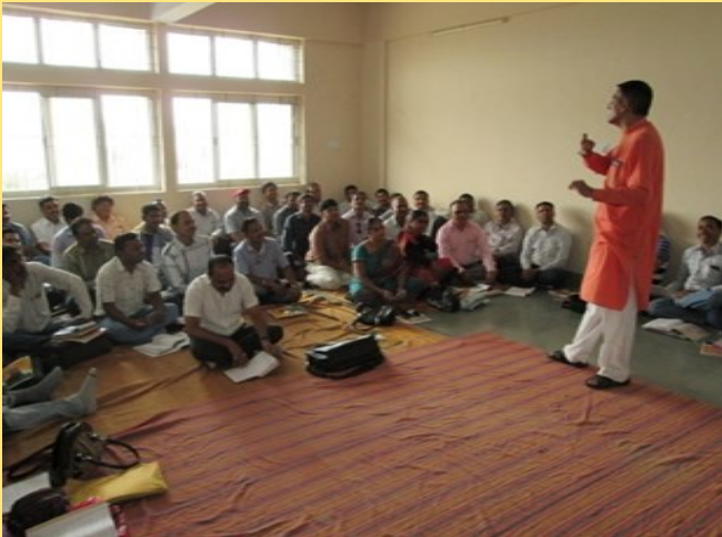
શારીરિક શિક્ષણ તાલીમ વર્ગ