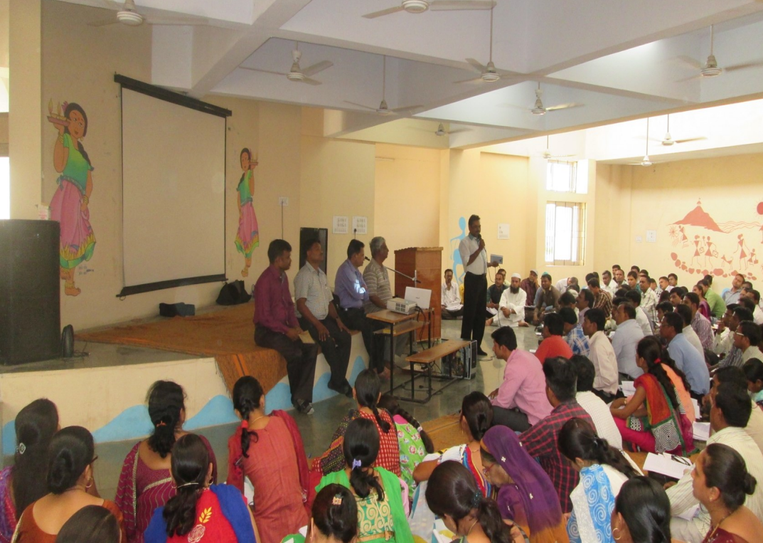
પ્રશિક્ષક અને અધ્યયન

પ્રવર્તમાન સમયે માનવામાત્ર એવા સ્થાને ઉભો છે જ્યાં અનરાધાર સદવિચારો કે કૃવિચારો રૂપી ધોધમાર વર્ષા થયા કરે છે. આવી ક્ષણે આપણે આપણા વિચારો સાથે આગળ વધતા રહેવાનું છે, ત્યારે આપણી પાસે સ્વતંત્ર વિચારશૈલી હોવી અતિ આવશ્યક છે.