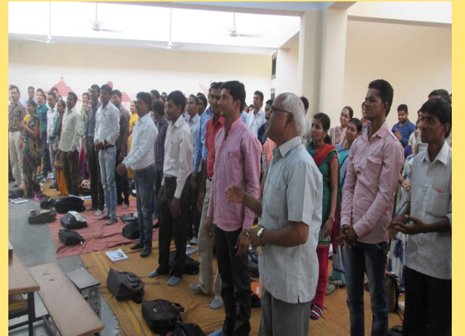
નવા અભ્યાસક્રમ સંદર્ભે સંકલ્પનાત્મક તાલીમ

૧.સંસ્કૃત તત્સમ શબ્દોની જોડણી મૂળ પ્રમાણે કરવી.દા.ત. ગુરુ,મતિ,વિદ્યાર્થિની,વૃદ્ધ,શુશ્રૂષા,પ્રામાણિક,નિમણૂક વગેરે.