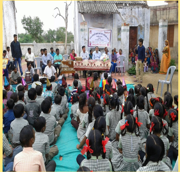
શાળા પ્રવેશોત્સવ કાર્યક્રમ