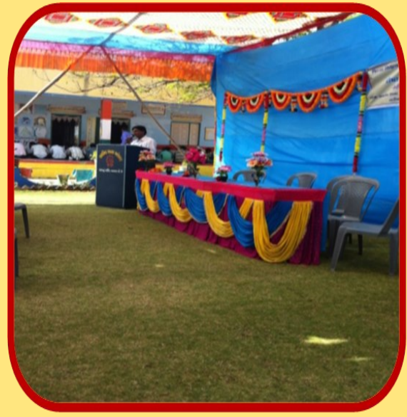
ઈનોવેટીવ શિક્ષક શેરીંગ વર્કશોપ