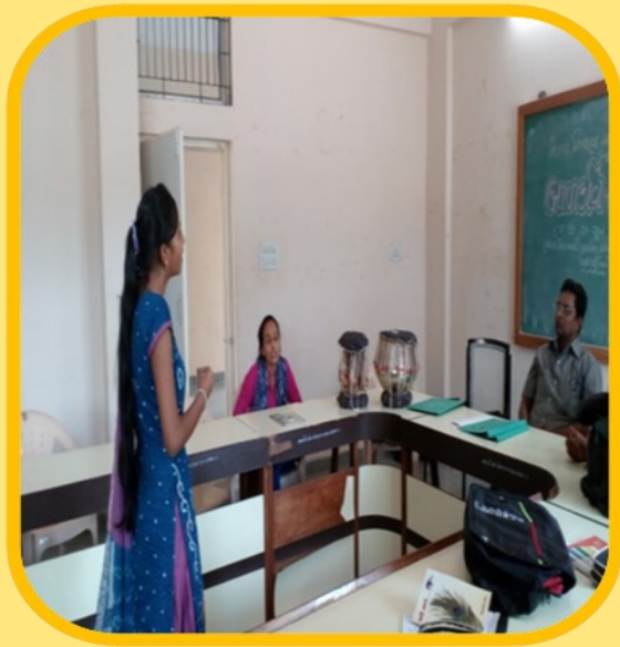
બાલકવિ માર્ગદર્શક કાર્યશિબિર